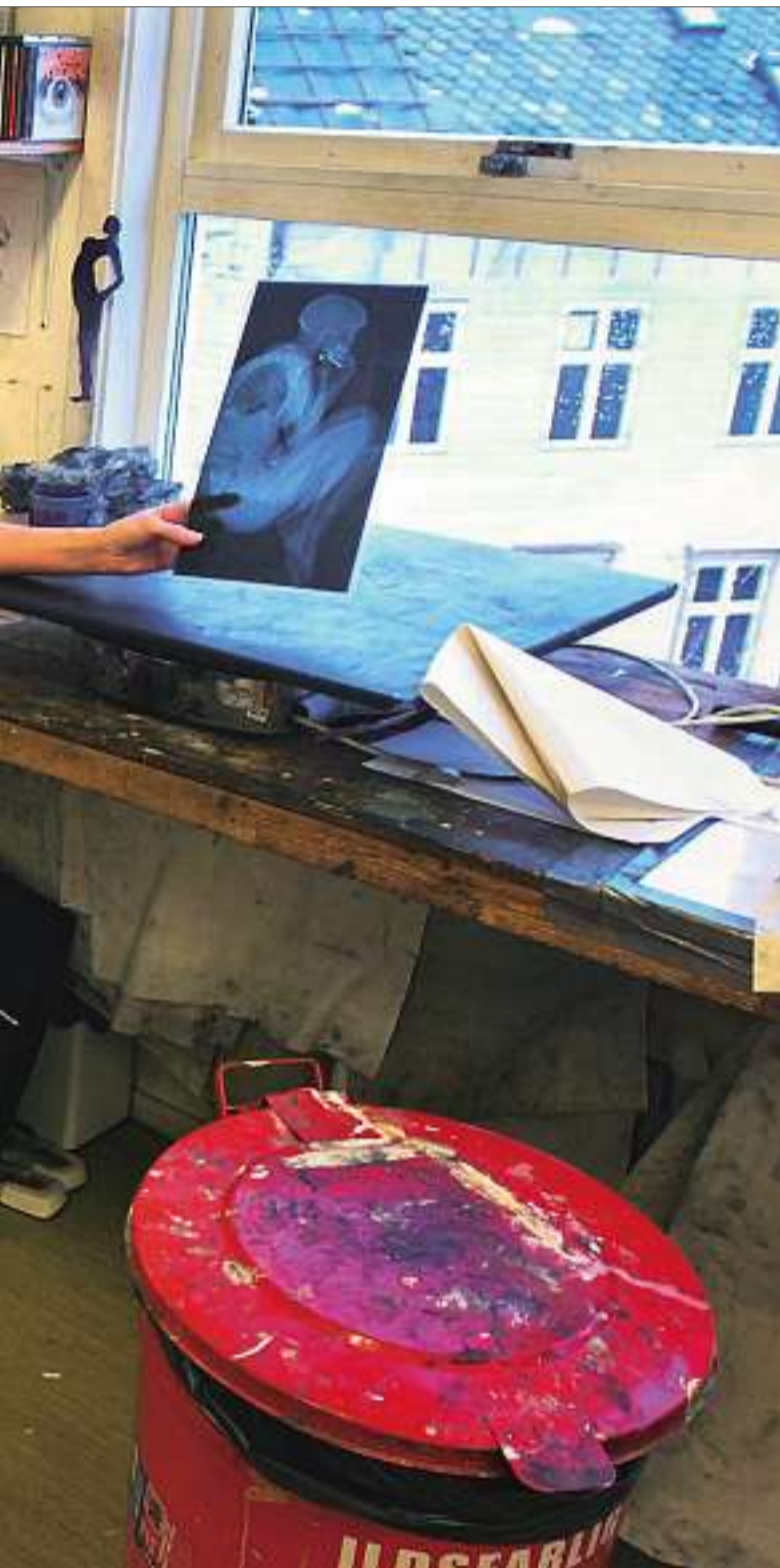
røntgenbilde av seg selv som hun har montert på en pleksiglassplate.

utøvende kunstner. – Men det går an å kombinere det å være kunstner med undervisning eller et annet yrke, mener hun.